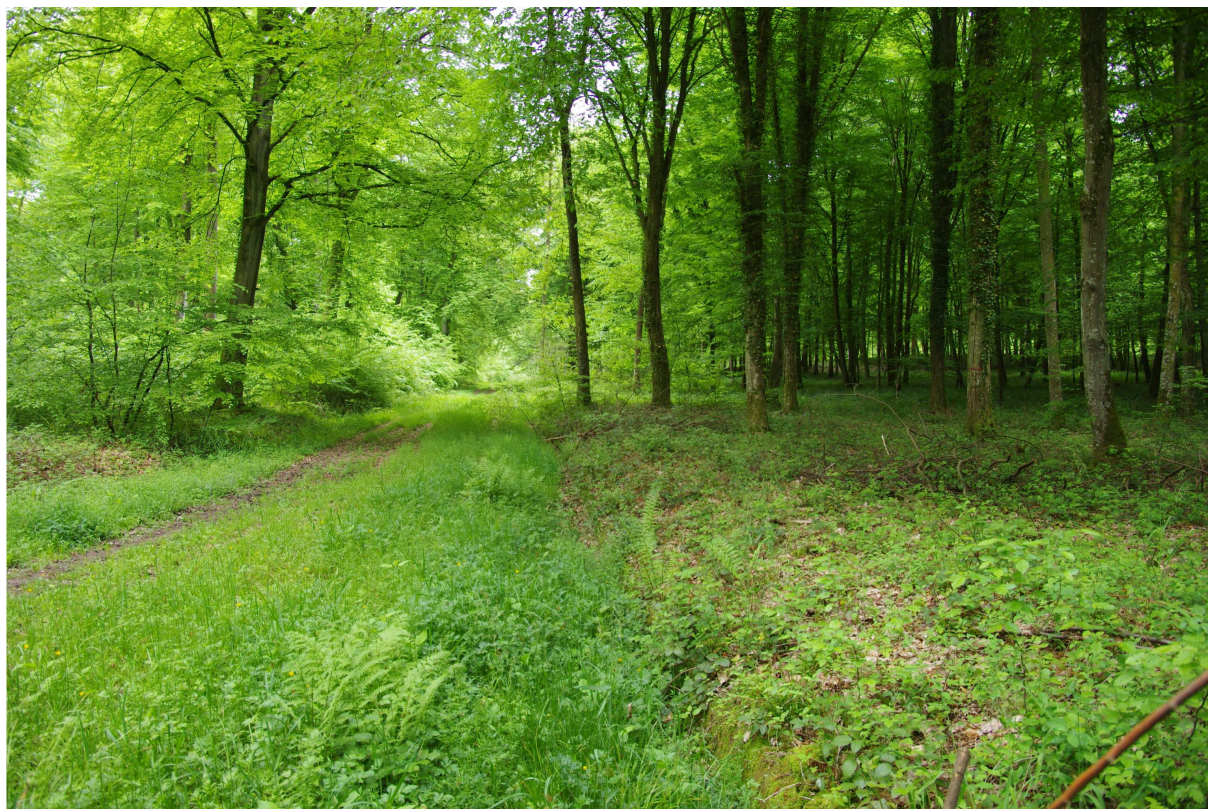
Photo 3 : vue de la laie du carrefour du Pré Geux vers la route communale