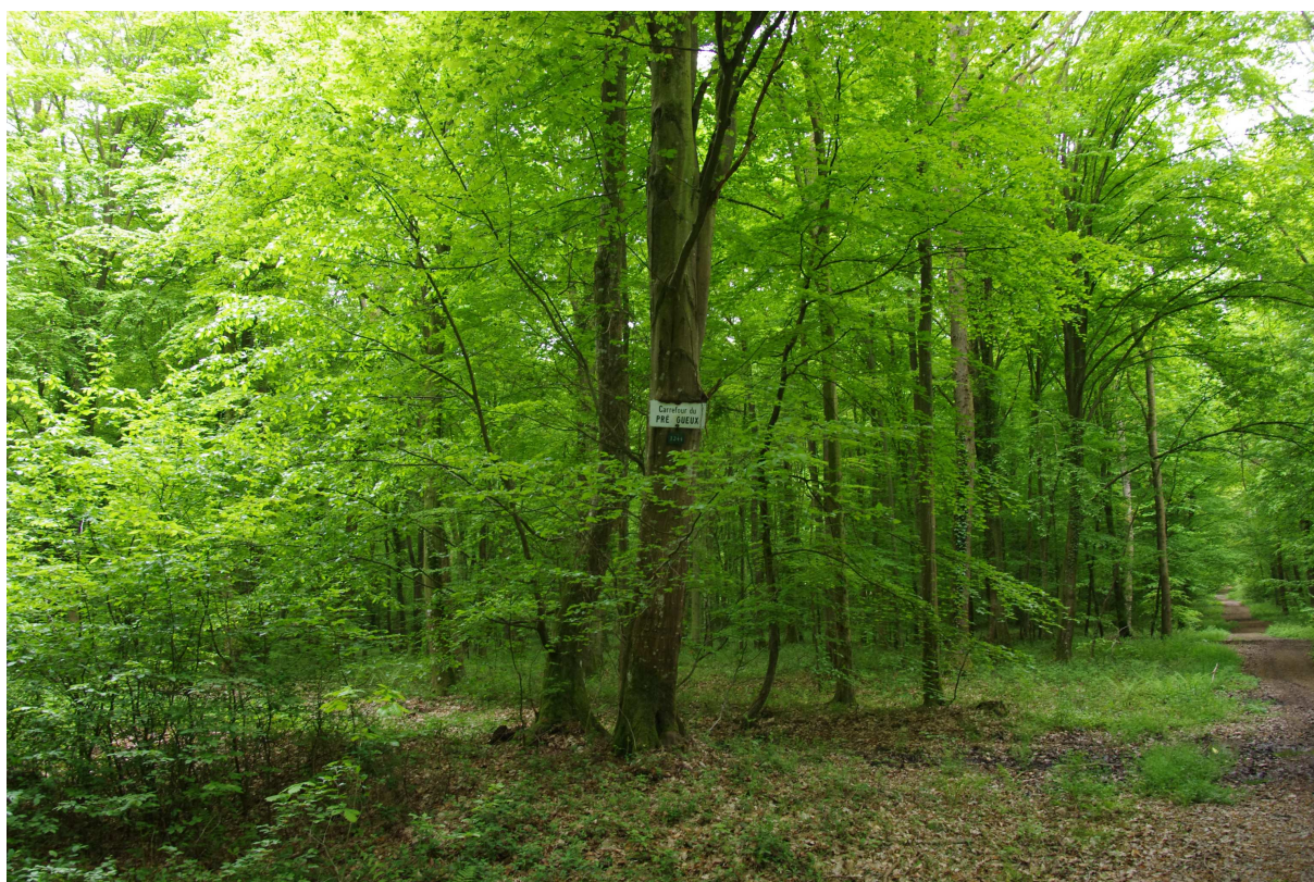
Photo 4 : localisation du carrefour du Pré Geux – secteur concerné par la place de retournement

Photographies prises le 14 mai 2013 – Jérôme Jaminon - ONF