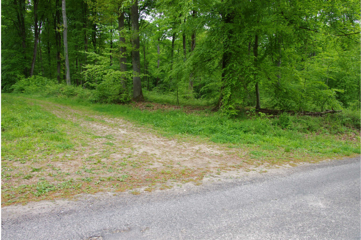
Photo 1 : intersection entre la route communale et la laie à empierrer