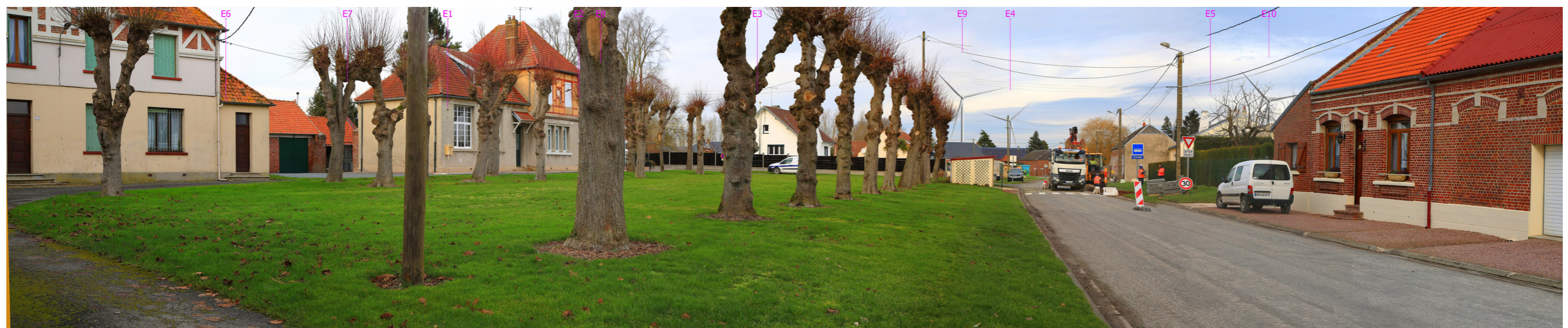
Photomontage 60, vue depuis la mairie de Chilly. Exemple de mesure d'enfouissement de câbles pour alléger l'impact visuel dû aux éoliennes.